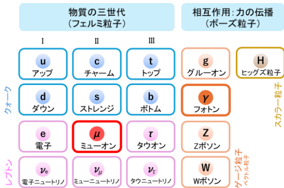
図1 素粒子の標準モデル [1]

ミューオンとは、素粒子の一つであり、図1に示す素粒子の標準モデルのうち、クォークと共に物質を形作るフェルミ粒子の仲間レプトンに分類されるものである。ミューオンは、電子の系列にあって、第II世代の粒子に位置付けられている。