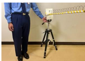
図 1 自作 GNSS L1 用ヘリカルアンテナ