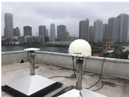
図 1 Topcon 社アンテナ(右)