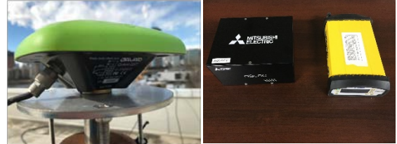
静止点のアンテナと受信機（AQLOC受信機ともう1台の基準となるトリムブル製SPS855受信機）