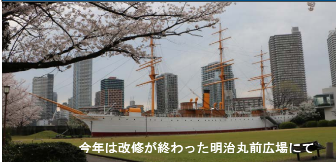
今年は改修が終わった明治丸前広場にて